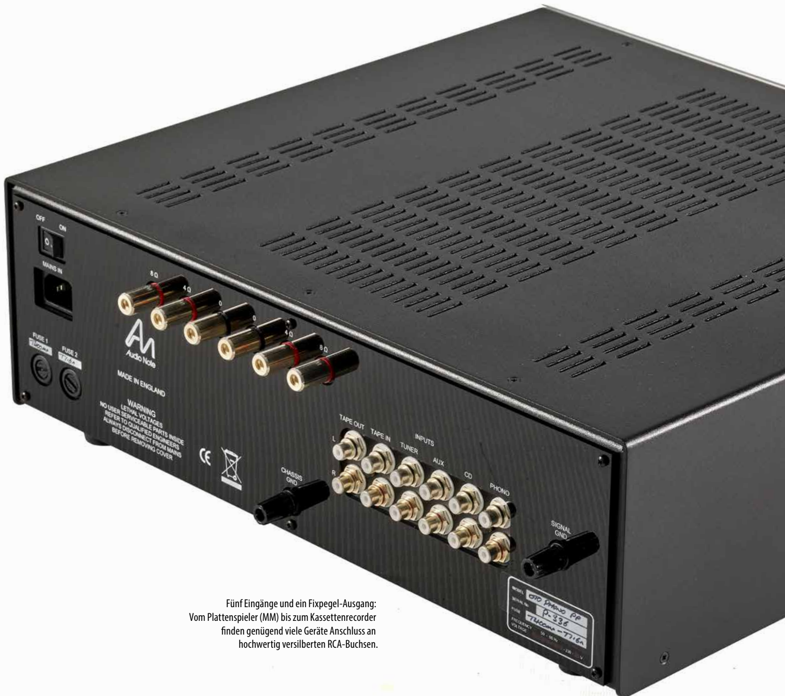
Fünf Eingänge und ein Fixpegel-Ausgang: Vom Plattenspieler (MM) bis zum Kassettenrecorder finden genügend viele Geräte Anschluss an hochwertig versilberten RCA-Buchsen.