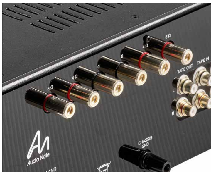
Röhre, wem Röhre gebürt: Bei den Lautsprecheranschlüssen hat man die gewohnte Qual der richtigen Wahl zwischen 4 Ω- und 8 Ω-Abgriff.

die jeweils verwendete Endstufenschaltung. Selbstverständlich kommen immer die haus-eigenen Übertrager zum Einsatz. Über weitere Details der Schaltung wird sich leider genauso ausgeschwiegen wie über die Preisgestaltung. Selbst die Händler sind angewiesen, keine Preislisten bekanntzugeben. Verraten kann ich aber immerhin, dass die Preise der verschiedenen Varianten des Oto von gut vier- bis fünfstellig reichen. Dementsprechend werden in der Audio-Note-eigenen Hierarchie die Verstärker der Oto-Serie mit Push-Pull-Schaltung als „Entry Level“ (Einstiegslevel) oder auch „Level 1“ bezeichnet, während die Single-Ended-Varianten bereits das Level 2 erreichen. Das derzeitige Maximum bei Audio Note wird übrigens mit Komponenten des Level 5 erreicht.