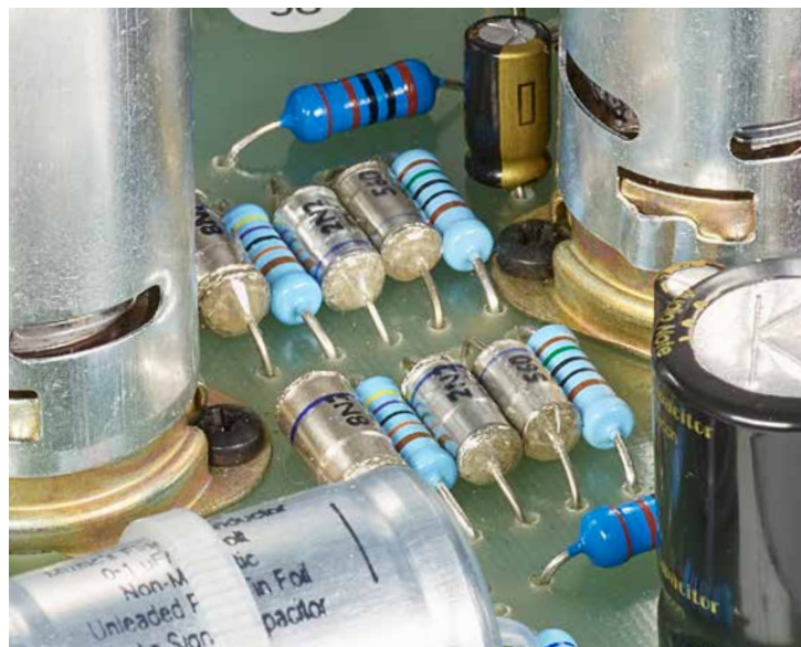
Mit Liebe zum Detail: Auch in der Nahaufnahme (hier: die Phonostufe) kann der saubere Aufbau des OTO überzeugen. Bauteile werden bei Audio Note erst nach ausgiebigen Hörtests ausgewählt.

vermissen. Die Nichtfernbedienbarkeit hat aber Tradition bei Audio Note.