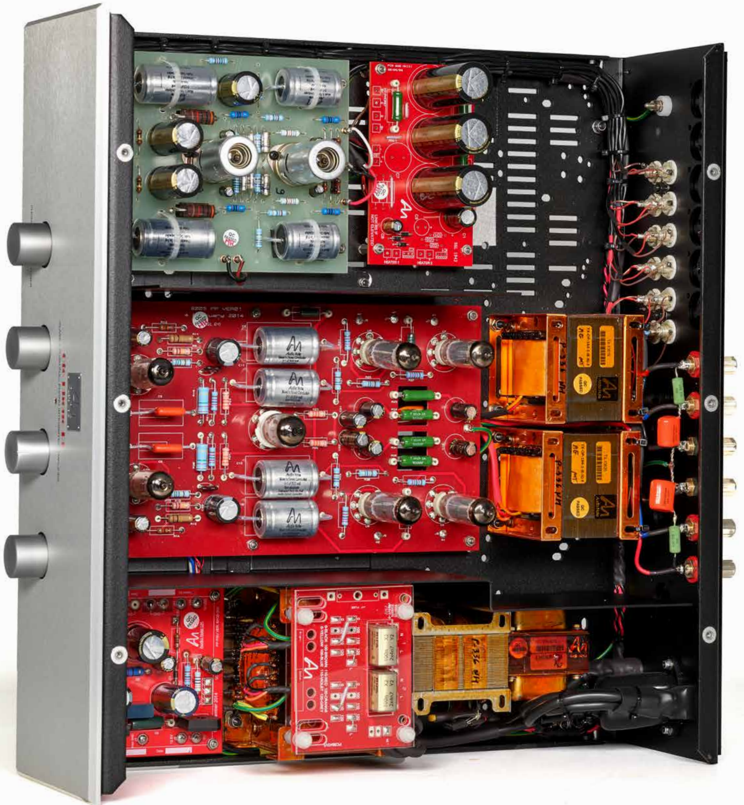
Sauber separiert: Unten liegt das Netzteil, in der Mitte der Hochpegel-Verstärker und oben der auch farblich abgegrenzte Phono-Vorverstärker.