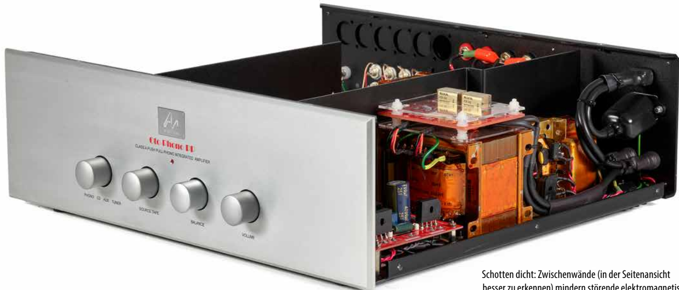
Schotten dicht: Zwischenwände (in der Seitenansicht besser zu erkennen) mindern störende elektromagnetische Einflüsse besonders des Netzteils.

Note sozusagen wiederzuentdecken. Es ist müßig, sie hier alle aufzuzählen. Ein besonderes Beispiel sei aber dennoch an dieser Stelle angeführt. Das ist die Filmmusik des cineastischen Meisterwerks Amadeus von Miloš Forman, in dem das Leben und Wirken von Wolfgang Amadeus Mozart eindrucksvoll (wenn auch historisch nicht ganz korrekt) in Szene gesetzt wurde. Dort findet man unter anderem das Konzert für zwei Klaviere KV 365. Zwar wurden die beiden Flügel während der Nachproduktion durchaus etwas in den Vordergrund gerückt, was der Oto auch keineswegs verschweigt, aber sie fügen sich trotzdem harmonisch in den virtuellen Raum ein, der zudem vollends ausgeleuchtet wird. Der kleine Audio Note unterschlägt also keine Details der räumlichen Wiedergabe. Überrascht haben mich die dynamischen Fähigkeiten des Oto. Man ist ja geneigt zu glauben, dass große Besetzungen mit einem